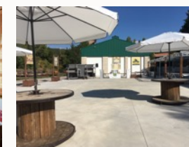
Plataforma eventos Capacidad 600 plazas