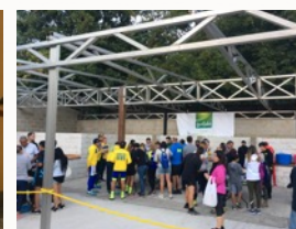
Carpa playa de vías Capacidad 150 plazas