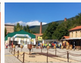
Parque ferroviario Eventos hasta 1.000 plazas