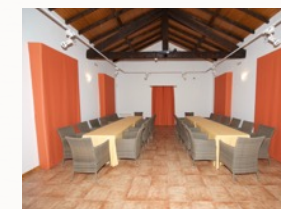
Salón multi-usos Comedor para 60 Plazas