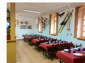
Cantina, "El Ferroviario" Comedor para 35 plazas