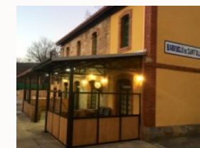
Terraza edificio viajero capacidad para 40 plazas