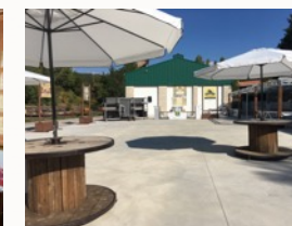
Plataforma eventos Capacidad 600 plazas